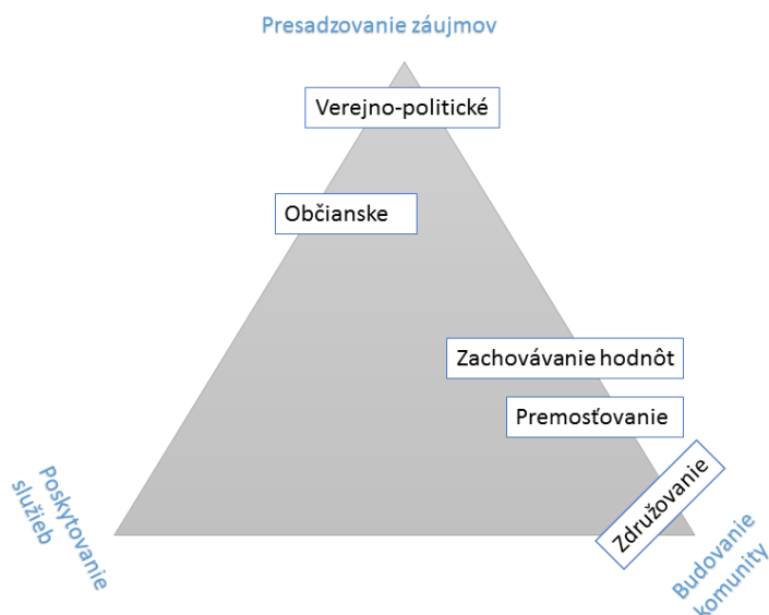
Obrázok 2 Typológia funkcií MNO