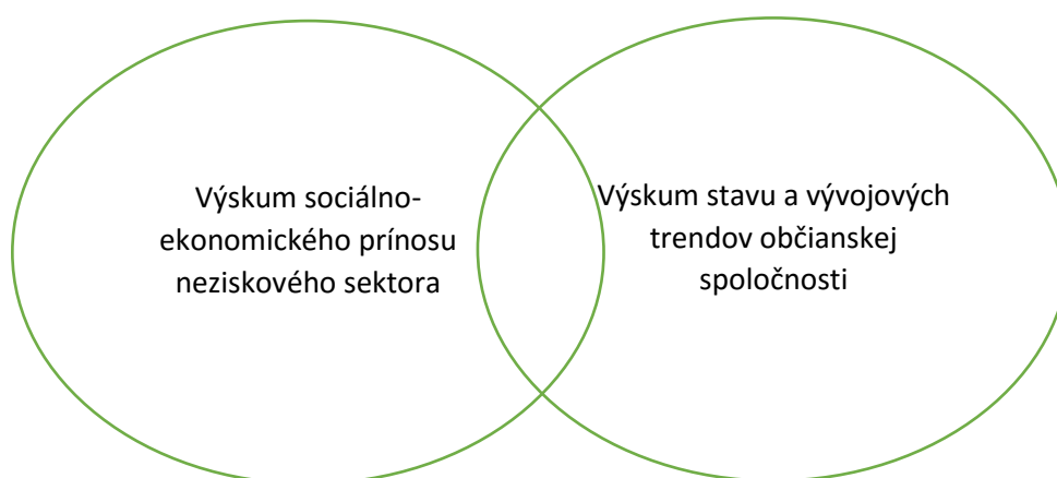
Obrázok 1 Výskum neziskového sektora a občianskej spoločnosti

Cieľom návrhu výskumu je špecifikácia výskumných otázok a metodológie zberu, analýzy, spracovania a diseminácie dát o ekonomických a sociálnych prínosoch neziskového sektora v kontexte súčasného stavu a vývojových trendov občianskej spoločnosti. Podrobná metodika výskumu (rozsah výskumu, výskumné otázky, požadované dáta, navrhované zdroje dát, spôsob zberu dát a ich vyhodnotenia) je rozpracovaná do návrhu projektu výskumu, ktorý bol tvorený vo vzájomnej spolupráci výskumného tímu a zástupcov ÚSVROS. Metodológia výskumu je založená na kombinácii rôznych spôsobov zberu dát a ich analýzy. Táto kombinácia (mixed method approach) umožní spoznávať neziskový sektor z rôznych perspektív a zároveň vytvorí predpoklady pre dlhodobé a systematické sledovanie kľúčových aspektov fungovania neziskového sektora a občianskej spoločnosti. Analýza je rozdelená do dvoch častí, ktoré sa vo viacerých témach a oblastiach navzájom prekrývajú, ako je uvedené na Obrázku 1.